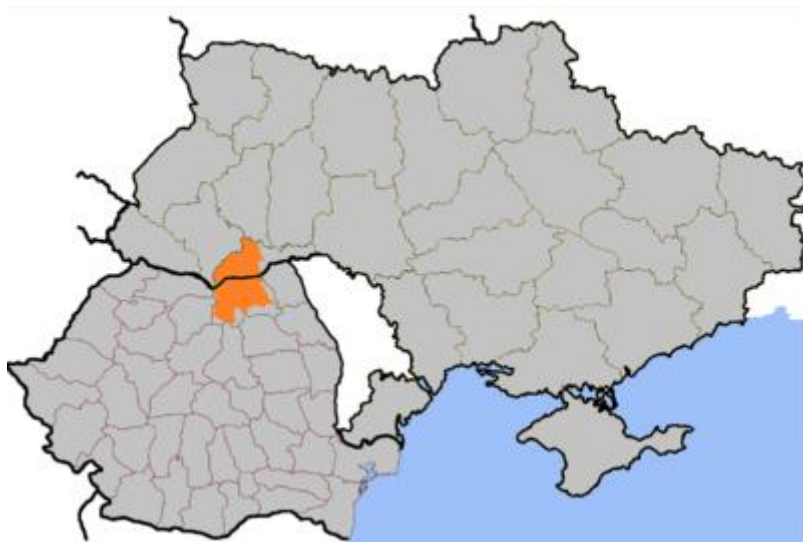
Bucovina suprapusă pe granițele actuale ale României și Ucrainei